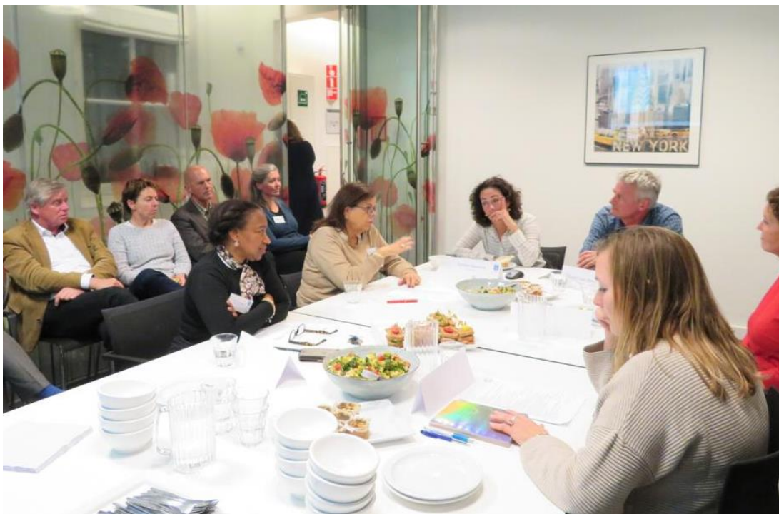
Burgemeester Halsema op bezoek bij Veilig Thuis Amsterdam-Amstelland 20 november 2018

Vanaf 1 januari 2018 voert Veilig Thuis Amsterdam-Amstelland samen met de politie de beoordeling voor een Tijdelijk Huisverbod (THV) uit. In 2018 is Veilig Thuis 408 keer uitgerukt om in een crisismelding samen met de politie de THV beoordeling te doen. Van deze 408 beoordelingen zijn in totaal 284 tijdelijk huisverboden opgelegd. In 124 gevallen is geen THV opgelegd. Deze 124 kregen via Veilig Thuis een ander vervolg.